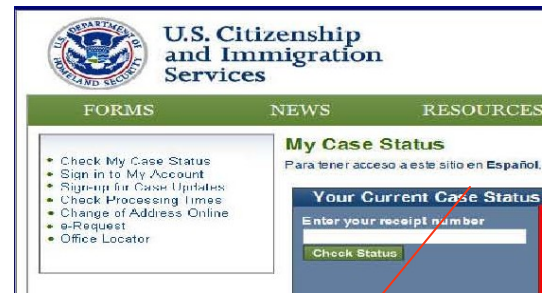
Acceso a la pagina web de USCIS en español